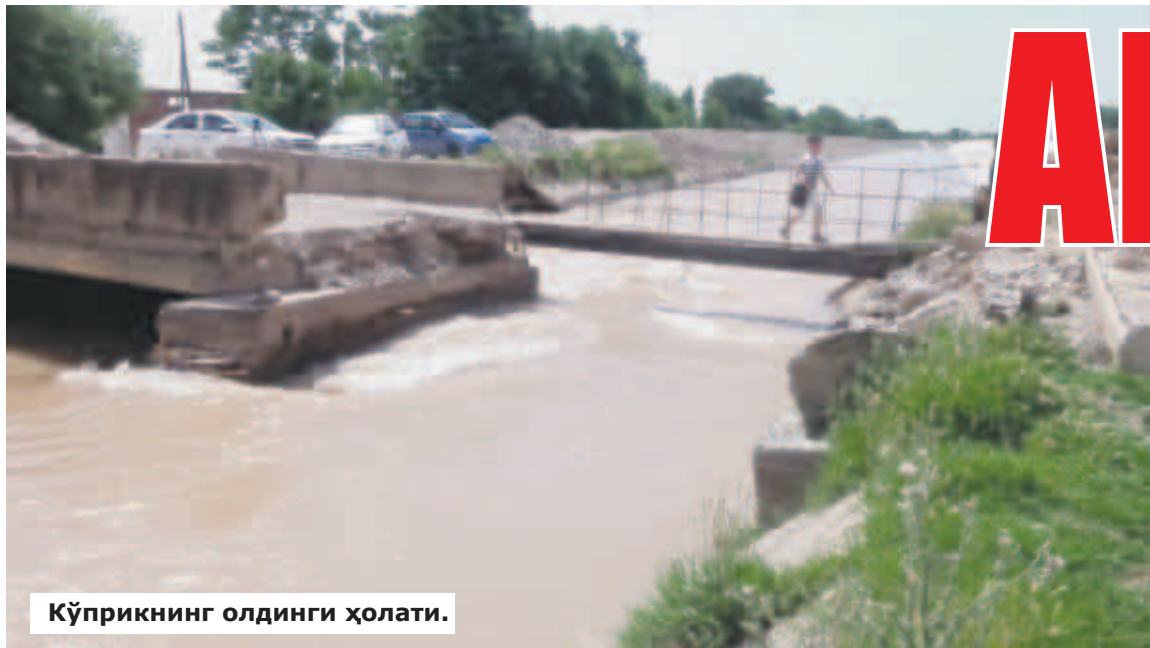
Кўприкнинг олдинги ҳолати.

ГАЗЕТАМИЗНИНГ 2022 ЙИЛ 11 МАЙ ҲАМДА 23 НОЯБРЬ СОНЛАРИДА ДЕНОВ ТУМАНИ "ЧЎНТОШ" МФЙДАГИ "ШАЙТОН КЎПРИК" ҲАҚИДА ТАНҚИДИЙ МАҚОЛАЛАР ЭЪЛОН ҚИЛИНГАНДИ.