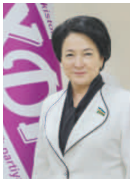
Қизилгул ҚОСИМОВА, Олий Мажлис Қонунчилик палатасидаги ЎзХДП фракцияси аъзоси:

– Ўзбекистон ва Қирғизистон ўртасида-ги дипломатик алоқалар ўрнатилганига 30 йилдан ошди. Яъни, 1993 йилдан бери ўзаро муносабатларни тартибга солуви 250 дан зиёд ҳужжатлар қабул қилинди.