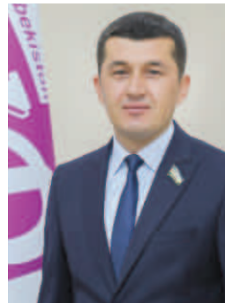
Анвархон ТЕМИРОВ, Олий Мажлис Қонунчилик палатаси депутати:

Кўришиб турибдики, вазифлар кўлами ниҳоятда кенг, ҳамкорликда белгиланган истиқболли режаларнинг салмоғи ҳам кат-та. Буларнинг бари биз учун ҳам, қардош қўшнимиз Қирғизистон учун ҳам манфаатли бўлишига ишонамиз.